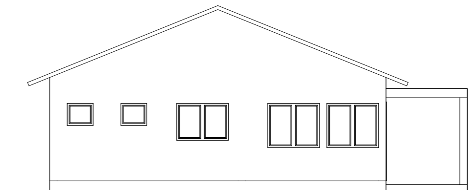
ALÇADO LATERAL DIREITO